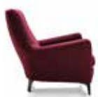
3 DENNY POLTRONA CM 88X95 H88