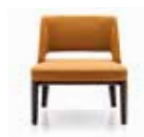
5 OWENS "ARMCHAIR" POLTRONA CM 72X72 H76