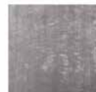
11 DIBBETS TAPPETO CM 500X400